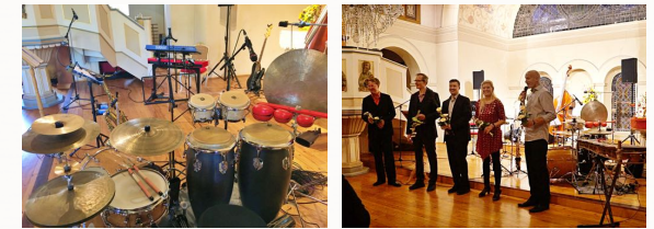
Die bunte Vielfalt an exotischen Klängen fasziniert kleine und große Konzertbesucher und animiert zu Mitmachen!

Ein Konzert mit Musik aus aller Welt ist immer etwas Besonderes! SpectaChoral nimmt bekannte Lieder aus dem Gesangbuch mit auf eine Reise um die Welt. Erlebnisse unserer eigenen Weltreise fließen in die Arrangements ein, gewürzt mit kleinen Anekdoten, moderiert mit dem von Gaston Endmann bekanntem Humor.