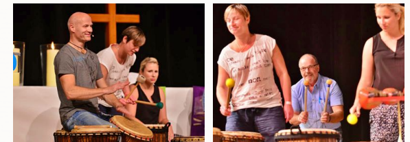
Hinter die Kulissen von SpectaChoral blicken, Arrangements und Rhythmen selbst umsetzen?

Sie wollen bekannte Gemeindelieder mal ganz anders klingen lassen oder einen besonderen Gottesdienst ausgestalten? Gemeinsam erkunden wir weltmusikalische Rhythmen und singen dazu uns bekannte Gemeindelieder. Weil das Ganze in der Gruppe noch viel mehr Spaß macht, wird es auch Tipps für die Vermittlung der Rhythmen geben, damit Sie Ihre Gemeinde aktiv einbeziehen können!