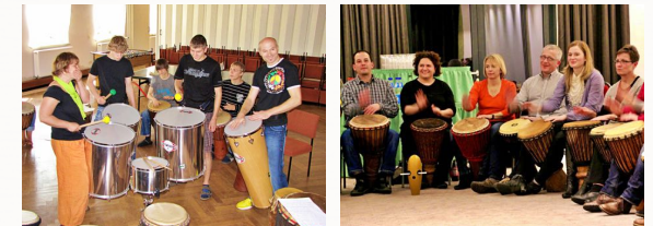
Einmal in die Welt der Percussion eintauchen und in der Gruppe verschiedene Rhythmen spielen?

Wie spiele ich Djembé, Bongos, Conga oder ein Cajon gemeinsam mit anderen? Die Welt der Percussion ist vielfältig wie keine andere Gruppe von Instrumenten. Welche Rhythmen sind afrikanisch, brasilianisch oder cubanisch und welche Instrumente sind jeweils typisch? Wie all dies in eine Band integriert oder zur Begleitung eines Chores genutzt werden kann, lernen Sie in diesem Workshop.