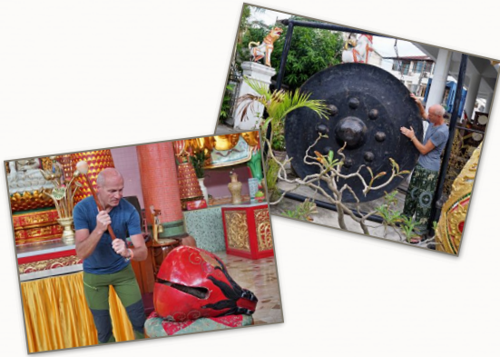
Riesige Tempelblocks in Malaysia oder mannshohe Gongs in Thailand - zu entdecken gibt es immer etwas!

„MUSIK KENNT KEINE GRENZEN UND VERBINDET MENSCHEN AUS ALLER WELT MIT EINER SPRACHE.“